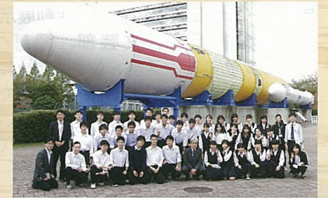
宇宙航空研究開発機構(JAXA)見学