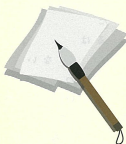
13R 新田真由さん 臨書「楽毅論」

島根県内で最優秀となり、県代表として全国審査へ。全国の高校387校、5,120作品中、第1位となり12月に島根県知事より直接表彰を受けました。なお、同コンクールで北高は平成26年、29年、30年にも全国入賞しており、30年は現2年生が文部科学大臣・総務大臣賞受賞を受けて、今年で2年連続同賞受賞となりました。